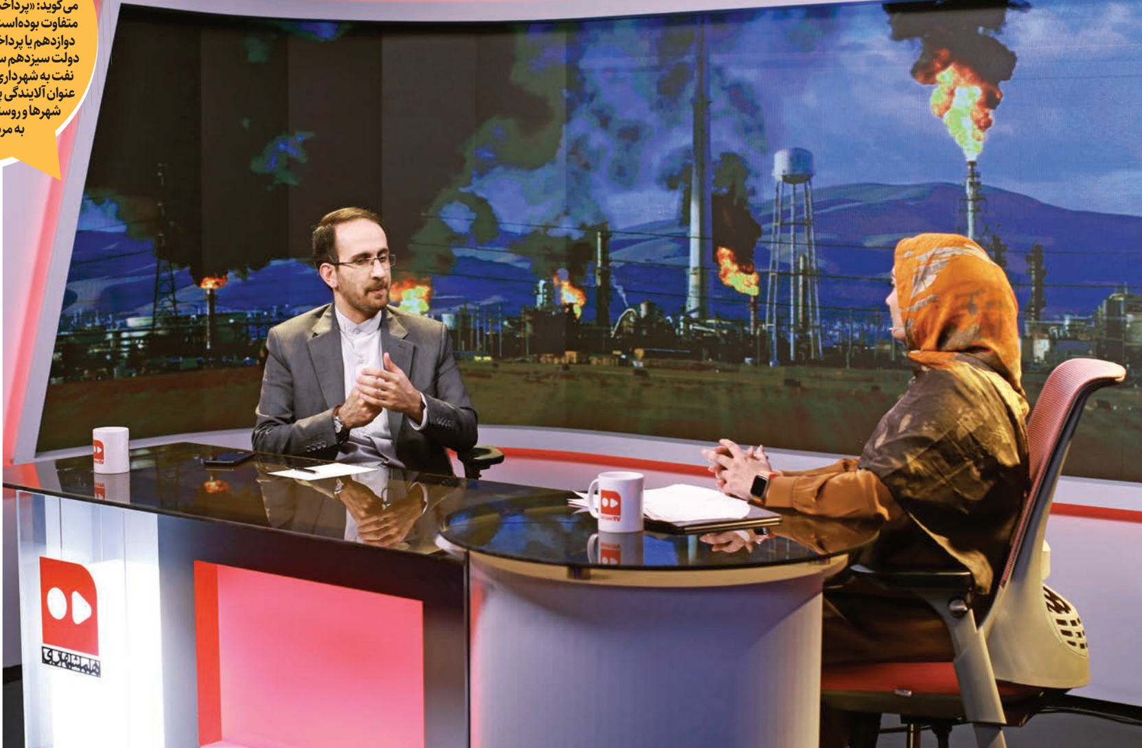
استودیوی تلویزیون همشهری آیکس/حامد خورشیدی