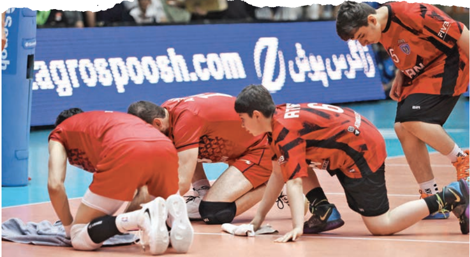
در چند صحنه بازیکنان فولاد بعد از بطری های آبی که تماشاگران شهداب به زمین پرتاب کردند، مجبور شدند خودشان زمین را خشک کنند.