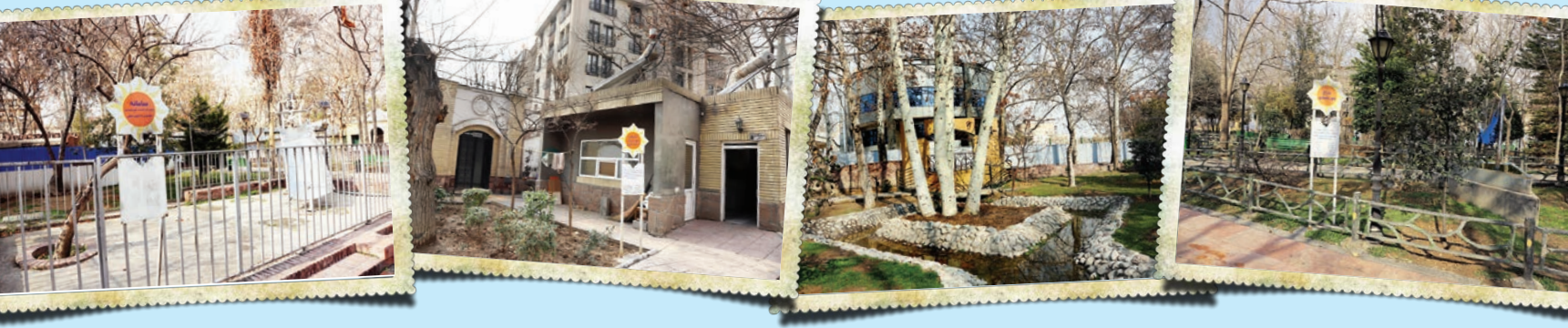
آب و نور؛ محور باغ موزه

یکی از محله های قدیمی شهرمان که به عنوان جاذبه گردشگری معرفی می شود منطقه بیلاقی در که است. در که از شمال با رشته کوه البرز، از شرق با پارک دانشگاه و اوین، از غرب با کوه توجال و سعادت آباد و از جنوب با وین همسایه است. شکل گیری این روستا قصبه خودش را دارد. معمولاً تهرانی ها فارغ از قصه هویتی و تاریخچه اش این محله زیبا را سراغ یکی از مسیرهای محبوب کوهنوردی و تفرجگاهی می شناسند. روایت های متعددی از علت نامگذاری در که وجود دارد؛ روایت هایی که برخی معتبر و برخی تنها به حدس و گمان شبیه است. برخی معتقدند وجه تسمیه نام در که از در مخفف دره و که علامت صغیر به معنای دره کوچک است، چرا که روستای در که در یکی از مسیرهای ورودی به کوه های البرز مرکزی و در دل دره های اطرافش قرار گرفته است.