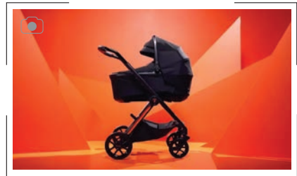
کالسکه با برند لامبورگینی

شرکت مطرح خودروسازی لامبورگینی، پس از تولید انواع عطر، ماکت‌های متنوع و پوشاک، اکنون کالسکه کودک تولید کرده است. این کالسکه با قیمت سرسام‌آور ۵ هزار دلار به بازار معرفی شده است. کالسکه کودک لامبورگینی با همکاری برند سازنده لوازم کودک بریتانیایی موسوم به سیلور کراس (Silver Cross) توسعه یافته است. این کالسکه کودک با نام تجاری Reef AL Arancio به فروش می‌رسد و طوری طراحی شده که در تمام سطوح به‌خوبی حرکت می‌کند. هدف این طراحی، پیش‌بینی تمام سناریوهای احتمالی است که در آنها سلامت کودک به خطر نیفتد.