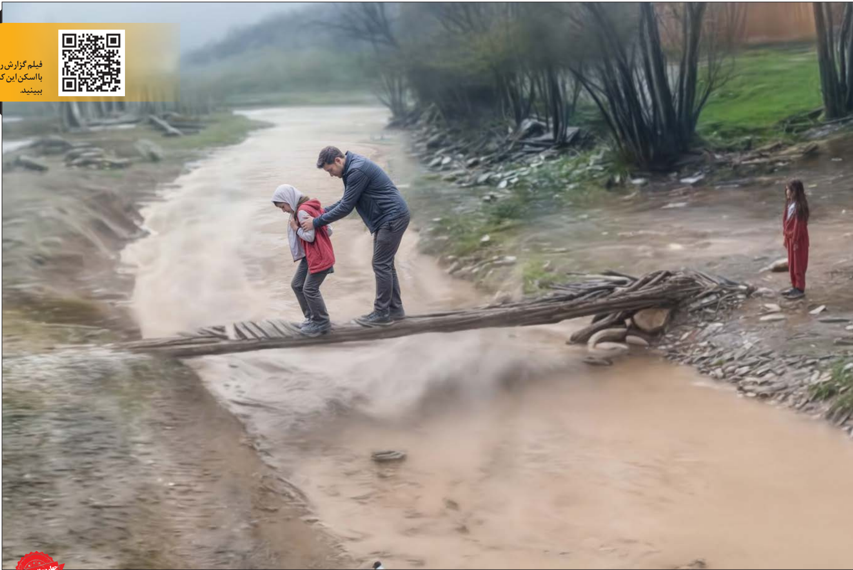
فیلم گزارش را با اسکن این کد ببینید.