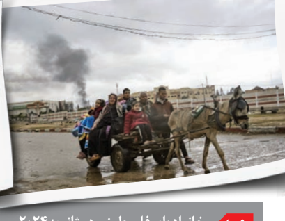
خانواده‌ای فلسطینی در ژانویه ۲۰۲۴ و هشدار تخلیه اجباری ارتش رژیم صهیونیستی در حال ترک خان یونس هستند. بسیاری از فلسطینی‌ها بارها و بارها مجبور شدند محل اسکان موقت را ترک کنند و آواره شوند.