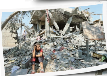
کودک فلسطینی در میان آوار نشسته است در حالی که فلسطینی‌ها خانه‌ای را که در حمله اسرائیل، در اردوگاه آوارگان نصیرات، در نوار غزه ویران شده برای یافتن قربانیان جست‌وجوی می‌کنند.