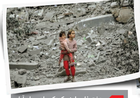
دختر فلسطینی کودکی را در میان آوار خانه‌های ویران شده توسط بمباران اسرائیل در شهر غزه در آغوش دارد.