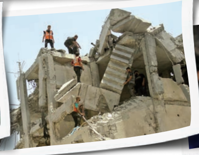
امدادگران فلسطینی در تلاش هستند تا مجروحان زیر آوار مانده ساختمان مسکونی را در منطقه قدیمی شهر غزه پس از حملات هوایی رژیم صهیونیستی نجات دهند.