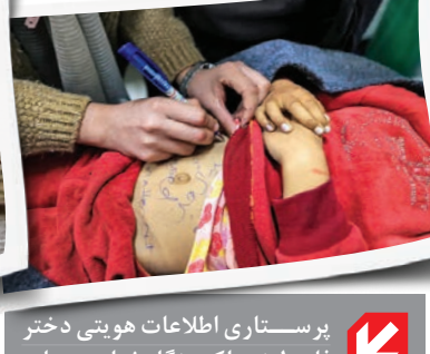
پرستاری اطلاعات هویتی دختر فلسطینی را که هنگام خواب در چادر پس از اصابت ترکش به سرش شهید شده روی بدنش یادداشت می‌کند. صهیونیست‌ها ۱۲ دسامبر ۲۰۲۳ به بیمارستان کویتی در رفح در جنوب نوار غزه حمله کردند.