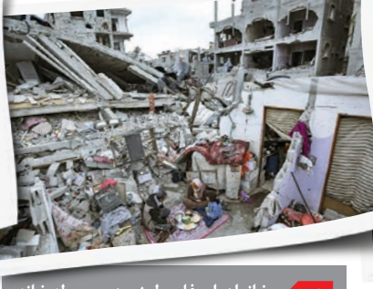
خانواده‌ای فلسطینی در محوطه خانه ویران شده خود در رفح به ساده‌ترین شکل ممکن در حال افطار در ماه رمضان هستند.