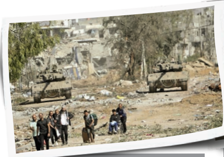
با برقراری آتش‌بس ۴ روزه در ۲۴ نوامبر ۲۰۲۳ فلسطینی‌ها شمال نوار غزه را ترک می‌کنند در حالی که تانک‌های ارتش رژیم صهیونیستی خیابان صلاح‌الدین را مسدود کرده‌اند.