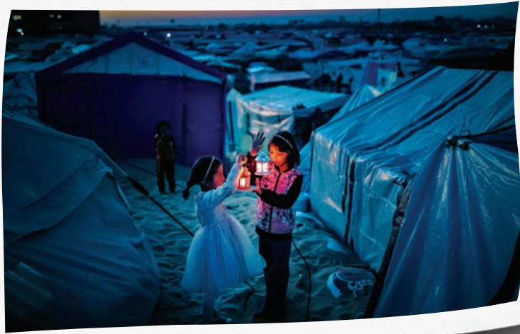
آوارگان فلسطینی در رفح غزه ۲۹ فوریه ۲۰۲۴ پیش از ماه مبارک رمضان چادرهای خود را با فانوس روشن می‌کنند. سازمان ملل تخمین می‌زند که نزدیک به ۲ میلیون نفر در غزه - ۹۰ نفر از هر ۱۰۰ نفر - حداقل یک بار، از هفتم اکتبر ۲۰۲۳ آواره شده است.

جنبش همبستگی که در ۱۵ ماه گذشته در انگلیس و سراسر جهان دیده شد، بازتابی از صبر و اراده غزه برای مقابله با اشغالگری بود. راهپیمایی‌ها و تظاهرات در لندن و دیگر شهرها نشان‌دهنده آگاهی جهانی از وضعیت غزه است. این جنبش نقش مهمی در افزایش اقدامات اشغالگر به جهان ایفا کرده و به عنوان پژواک صبر مردم فلسطین که توجه جهانی را به خود جلب کرده، عمل کرده است. آنچه غزه به دست آورده، نشان‌دهنده تحمل مردم فلسطین در برابر تجاوز بی‌وقفه است. این دستاورد تنها نتیجه حمایت خارجی نیست، بلکه محصول صبر و مقاومت مردم غزه است. غزه به جهان نشان داد که اراده یک ملت که مصمم به ادامه دادن است، نمی‌تواند در هم شکسته شود و پایداری در برابر بی‌عدالتی راهی به سوی آزادی نهایی است.