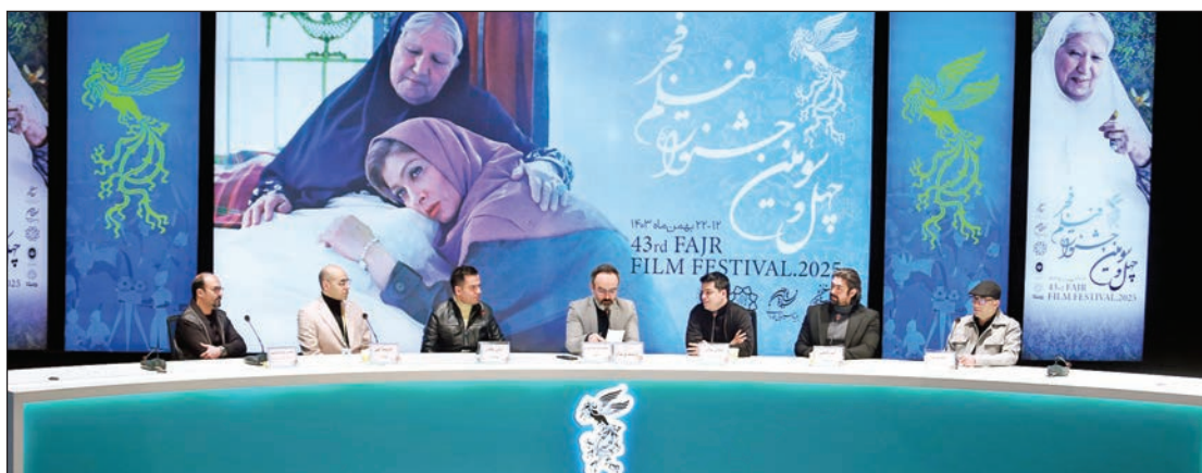
نشست خبری فیلم ژولیت و شاه