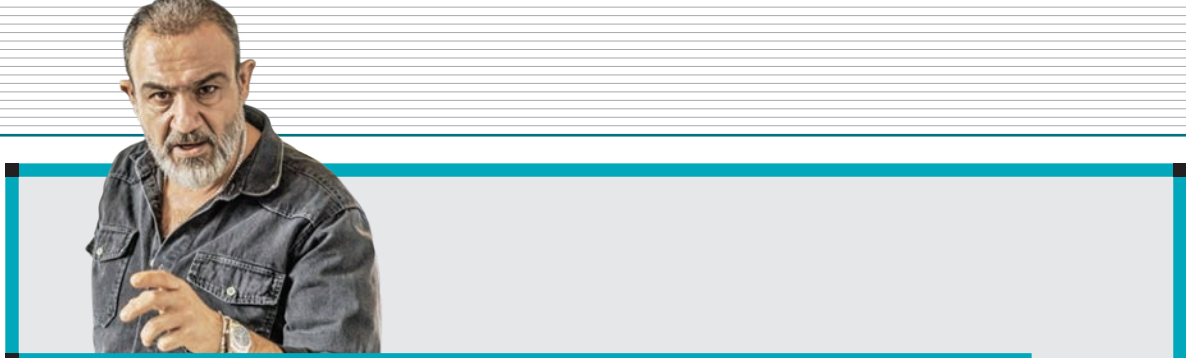
یک سکانس از فیلمنامه «زیبا صدایم کن»