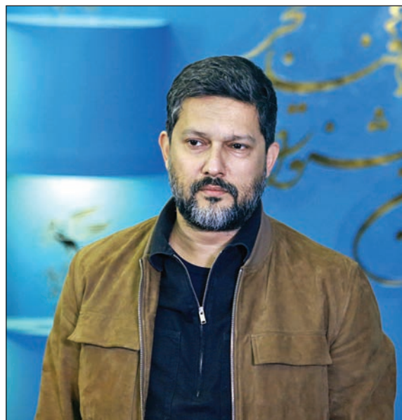
حامد بهداد در فتوکال انیمیشن ژولیت و شاه حاضر شد