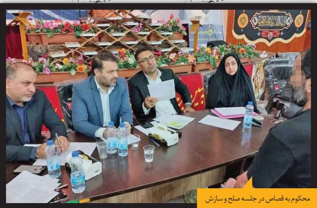
محکوم به قصاص در جلسه صلح و سازش

متهم به قتل در ادامه صحنه جنایت را بازسازی و جزئیات بیشتری از آنچه اتفاق افتاده را بازگو کرد. در نهایت پرورنده با صدور کیفرخواست به دادگاه کیفری یک استان هرگزمان فرستاده شد و متهم طی میز محاکمه قرار گرفت. در جلسه دادگاه، اولیای دم برای متهم درخواست صدور حکم قصاص کردند و در ادامه او در جایگاه قرار گرفت و به دفاع از خود پرداخت. قاتل گفت: هیچ وقت فکرمش را هم نمی‌کردم که روزی به خاطر قتل نزدیک‌ترین دوستم محاکمه شوم. آن شب هر دو نفر از سر کار برگشته بودیم و من خسته و گرسنه بودم. وقتی با هم بگومگو کردیم، من یک لحظه از کوره در رفتم و در حال عصبانیت دوستم را زدم. به همین دلیل از اولیای دم می‌خواهم من را به خاطر جوانی‌ام ببخشند. من ناخوسته مرتکب قتل شدم و حالا هم عذاب وجدان رهایم نمی‌کند. باوجود درخواست متهم، اولیای دم برای مجازات متهم اصرار داشتند و در شرایطی که همه شواهد و مدارک علیه متهم بود، او به قصاص محکوم شد. این رأی مدتی بعد نیز در دیوان عالی تأیید و همه‌چیز برای اجرای حکم آماده شد.