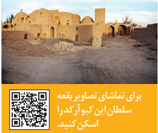
برای تماشای تصاویر بقعه سلطان این کیوب را کدرا اسکن کنید.

حمام قاجاری «گودی» یکی از آثار است که طی روزهای گذشته ثبت ملی آن ابلاغ شد. حمامی که در بافت تاریخی شهر شیراز قرار گرفته و در حال حاضر کاربری ندارد. مساحت حمام حدود ۶۰۰ متر مربع و دارای تمامی عناصر اصلی حمام های قدیم ایرانی شامل هشتی ورودی، بینه، میان در، گرم خانه، خزینه و چال حوض است. حمام گودی در داخل زمین واقع شده است و بام آن حدود ۵ متر از سطح کوچه ارتفاع دارد. این شگرد تبادل حرارتی را در زمستان و تابستان میان داخل حمام و فضای خارج آن به حداقل می رساند.