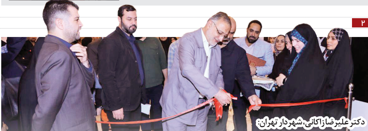
دکتر علیرضا زاکانی، شهردار تهران