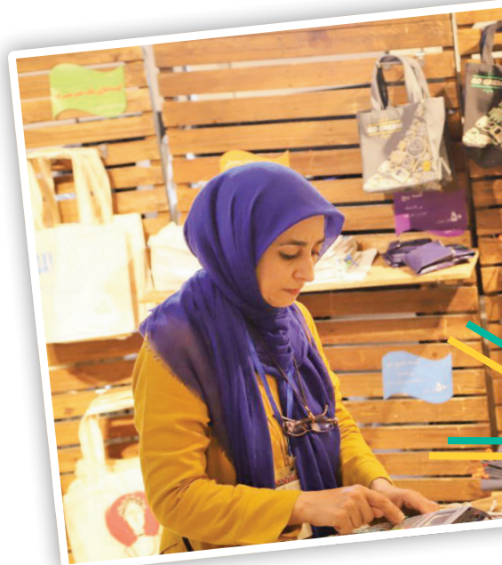
آخرین آمار ثبت شده در سامانه توانمندسازی زنان سرپرست خانوار