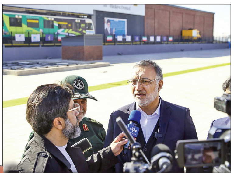
علیرضا زاکانی شهردار تهران: