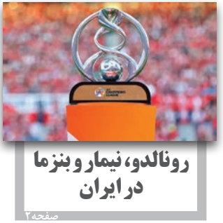
رونالدو، نیمار و بنزما در ایران