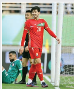
سردار در تیم آقای خاص باشگاه مشهور ایتالیایی مشتری مهاجم ایرانی شد