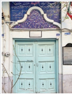
میراث شیخ در قلب تهران آرامگاه شیخ هادی نجم‌آبادی مجتهد دیندار، مامن دلدادگان است