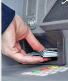
افزایش یارانه به ۴۲۰ هزار تومان دهک‌های چهارم و پنجم مشمول یارانه تشویقی می‌شوند