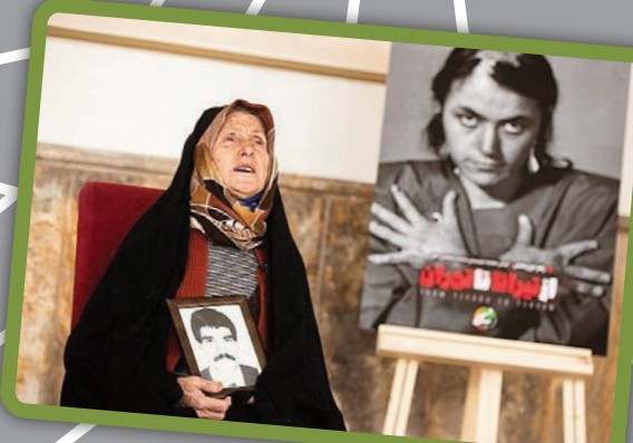
مادر یکی از افرادی که در اردوگاه منافقین گرفتار است در مراسم اکران مستند از تیرانا تا تهران