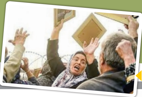
نمایی از فیلم سینمایی «سرهنگ ثریا»

خانواده را هدف گرفت و بنا را به متلاشی کردن کامل خانواده‌ها قرار داد. این بار نیز کودکان که سد و مانع رسیدن به این مهم بودند از سر راه برداشته شدند و بهانه‌اش هم شد جنگ خلیج فارس. سازمان به بهانه اینکه کودکان را از عواقب جنگ مصون نگه‌دارد، والدین را با انواع ترغیب‌ها راضی کرد تا کودکان‌شان را به سازمان بسپارند تا سازمان بنا به صلاحدید خود آنها را به دیگر کشورها همچون آمریکا، کانادا، استرالیا و کشورهای اروپایی منتقل کند. به این ترتیب سازمان زمینه پیاده‌سازی کامل طلاق ایدئولوژیک و جداسازی زوج‌ها را فراهم کرد و کنترل جسم و روح نیروها را به زعم خود به‌طور کامل در اختیار گرفت.