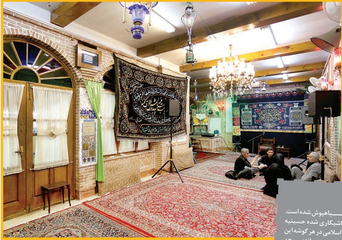
ارادت ۳ تنسل به اهل بیت ۴