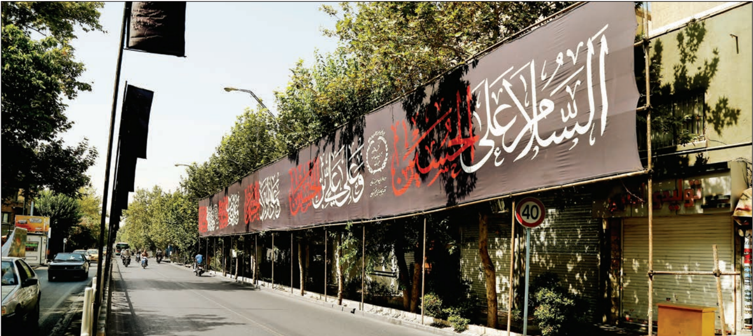
عکس همسفرهای رانسان‌راله