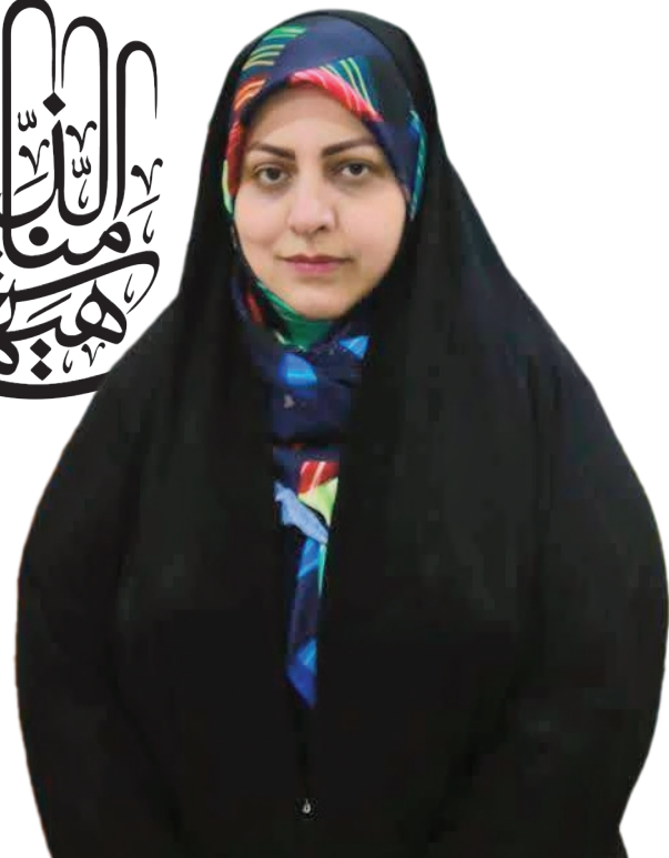
متن تقریظ رهبر معظم انقلاب