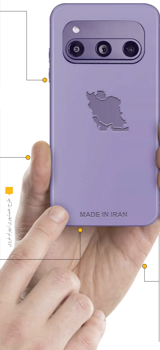
فیلد همشهری ایران‌گرام

اگر قرار است شاهد توسعه اقتصاد دیجیتال در کشور باشیم، لازم است که دولت گوشی‌های هوشمند ارزان در اختیار کاربران ایرانی قرار دهد تا مردم با استفاده از آن به توسعه اقتصاد دیجیتال کمک کنند