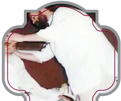
امام راحل به آراستگی ظاهری‌شان بسیار اهمیت می‌دادند

روز ۲۴ آذر سال ۱۳۶۱ نامه‌ای به دفتر امام رسید که نگارنده دانش آموزان دبستان دخترانه فاطمیه تهران بودند؛ دانش آموزانی که در نامه خود قصد نصیحت کردن امام را داشتند اما در میانه راه از این کار خود پشیمان شدند. در قسمتی از این نامه آمده: امام عزیز، ما بچه‌های کلاس پنجم جهاد مدرسه فاطمیه هستیم. چون در کتاب دینی ما نامه امام محمد تقی (ع) را به فرمانده سیستم و نصیحت‌هایی را که امام به ایشان کرده‌اند نوشته، ما هم تصمیم گرفتیم که برای شما نامه‌ای نوشته و شما را نصیحت کنیم. ولی اماما، ما شما را نمی‌توانیم نصیحت کنیم. زیرا شما بزرگوارید و از همه گناهان به دورید. اماما، ما بچه‌های کوچک از ته قلب مان، ۳ خواهش از شما داریم و امیدواریم لیاقت آنها را داشته باشیم. اول آنکه: ای پدر بزرگوارمان، ای پیر جماران، ای روح خدا با خط زیبا خودتان برای ما جواب بنویسید و ما و آموزگاران مان را در آن نصیحت کنید. دوم آنکه: عکسی از