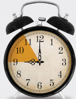
۲۳ تا ۲۱ شب