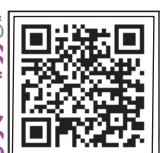
این روایت تهران را با اسکن این کیوآر کد ببینید.