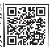
این روایت تهران را با اسکن این کیوآر کد ببینید.