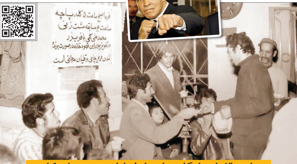
این روایت تهران را با اسکن این کیوآر کد ببینید.