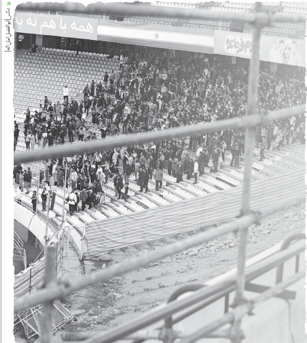
عکس: اپو انفصل امن الیا