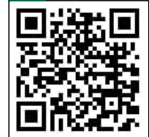
تصویری دیدنی اجتماع روزه اولی هادر تیمه های عباس آباد را با اسکن این کیو آر کد ببینید.

۳۰ هزار نوجوان روزه دار، بزرگترین اجتماع روزه اولی ها در تهران را تشکیل دادند