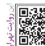
این روایت تهران را با اسکن این کیوآر کد ببینید.

اراضی نزدیک به بوستان سرخه حصار که آخر هفته‌ها پاتوق گردشگران و طبیعت‌دوستان است، روزگاری شکارگاه شاهان قاجار بود. مظفرالدین شاه و ناصرالدین شاه با خدم و حشم خود در آبادی دوشان تپه جادر می‌زدند تا خرگوش و گاهی پلنگی خوش خط و خال نصب‌شان شود. شاهان قاجار به‌ویژه مظفرالدین شاه و ناصرالدین شاه شیفته شکار بودند. می‌گویند ناصرالدین شاه هر وقت که خلقتش تنگ می‌شد، خدم و حشم دربار می‌دانستند که باید بساط شکار را برای سلطان صاحبقران فراهم کنند. شاه قاجار تفنگ بر دوش با کاروانی طولیل از خدم و حشم راهی شکارگاه‌های خود می‌شد. یکی از شکارگاه‌های محبوب او روستای «دوشان تپه» در شرق دارالخلافه بود که ناصرالدین شاه به هوای شکار خرگوش و گاهی هم پلنگ‌های خوش خط و خال