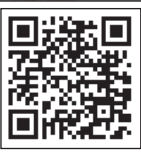
این روایت تهران را با اسکن این کیوآر کد ببینید.