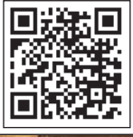
این روایت تهران را با اسکن این کیوآر کد ببینید.