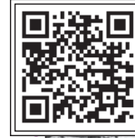
این روایت تهران را با اسکن این کیوآر کد ببینید.