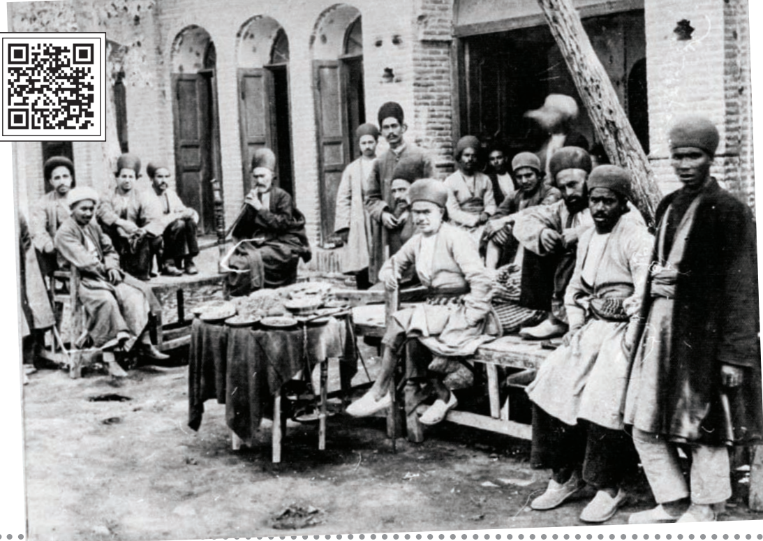
این روایت تهران را با اسکن این کیو آر کد ببینید.

در بین مردم باز کرد. قهوه‌خانه‌ها در تهران قدیم علاوه بر مکانی برای نوشیدن چای یا قهوه، محلی برای اجتماعات سیاسی، اجتماعی و فرهنگی نیز بود. در واقع، این اجتماعات و تبادل افکار، اندیشه و عقاید سیاسی و اقتصادی یکی از مهم‌ترین عواملی بود که باعث رونق قهوه‌خانه‌ها شد. به همین خاطر در اواخر دوره قاجار به اغلب اصناف در یک قهوه‌خانه پاتوق می‌کردند و هر یک از قهوه‌خانه‌ها مخصوص یک صنف بود. این پاتوق‌ها برای اعضای هر صنف حکم رسانه‌های امروزی را داشتند. در این پاتوق‌ها، اخبار همان صنف، نرخ دستمزد و اطلاعات فنی برای تازه‌کاران و احياناً تغییراتی که قرار بود رخ دهد طرح و بررسی می‌شد. به گفته معانی در آن دوران تعداد قهوه‌خانه‌های سنتی در تهران ۴ هزار و ۲۰۰ تا ۴ هزار و ۵۰۰ باب بود.