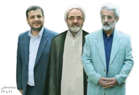
صفحه‌های ۲۴ و ۲۵

منافع مدیران مانع تحول در حکمرانی خوب است