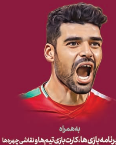
به همراه پوستر برنامه بازی ها، کارت بازی تیم ها و نقاشی چهره ها