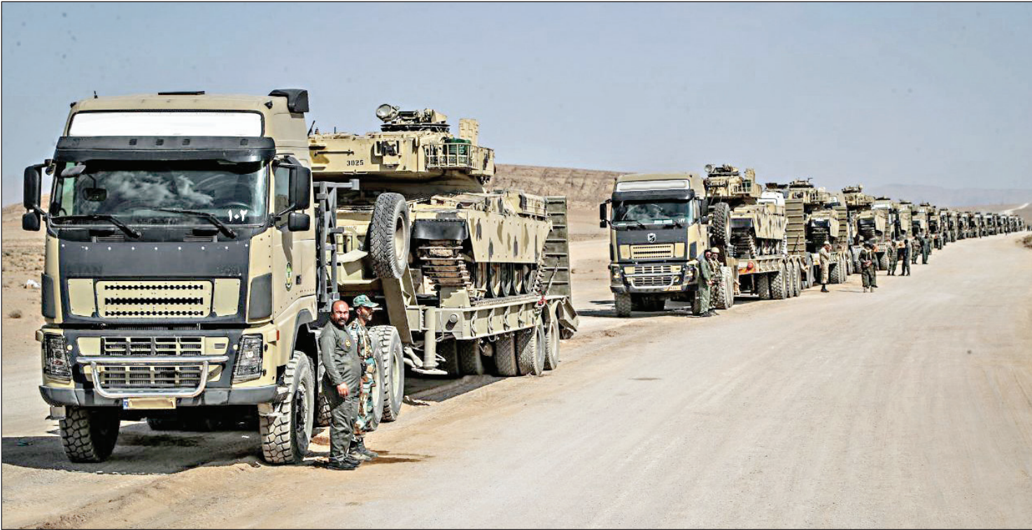
رزمایش انتقال رزمی روزهای اخیر در منطقه ارس بر گزار شد.