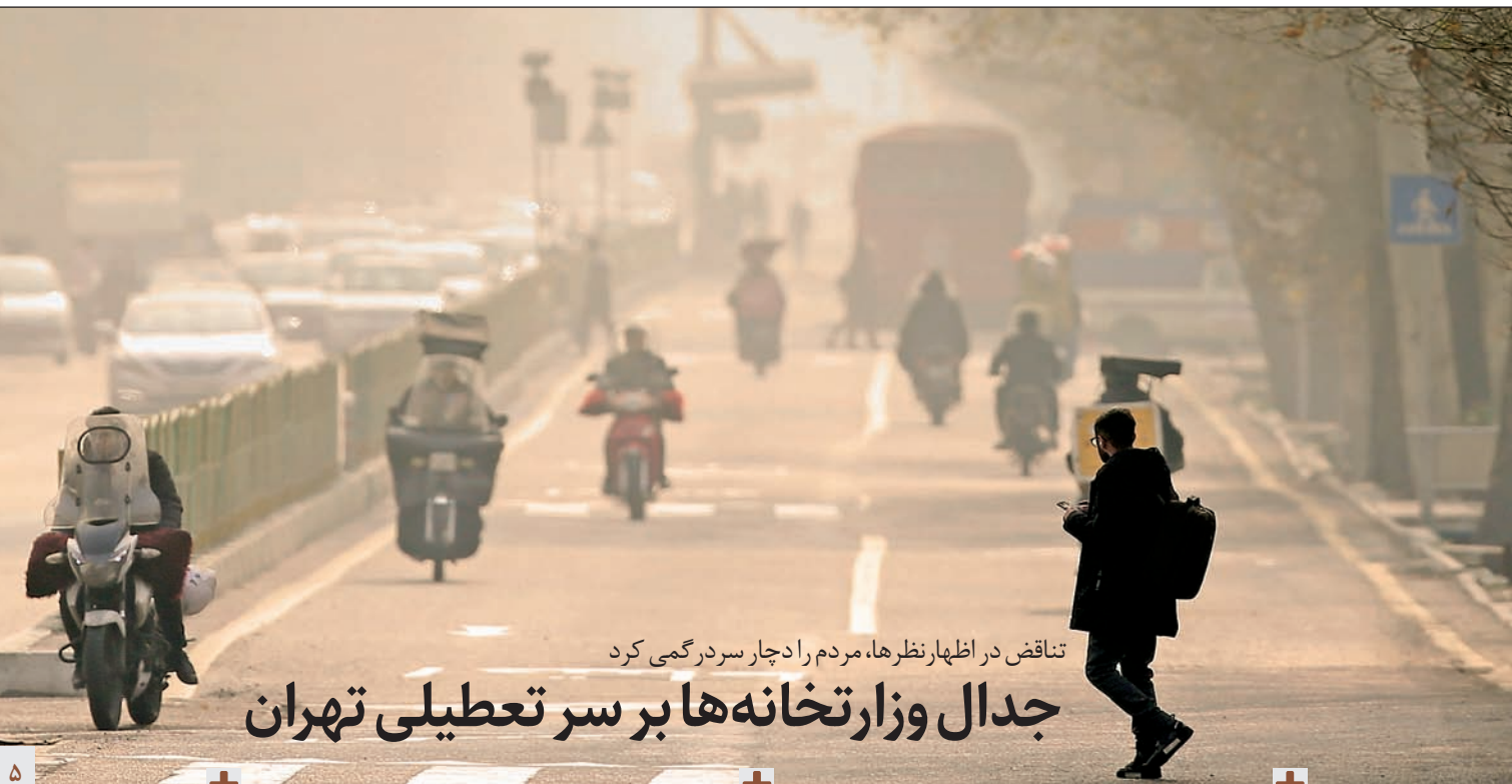
تناقض در اظهار نظرها، مردم را دچار سردرگمی کرد