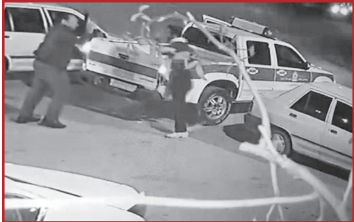
لحظه شهادت افسر پلیس

شهادت مظلومانه افسر پلیس در بیدزرد شیراز به دست مرد شرور، احساسات عمومی را جریده‌دار کرد