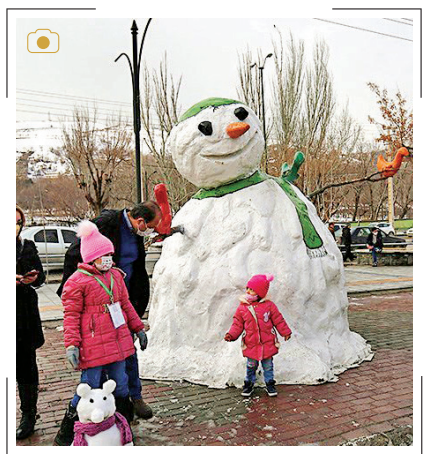
جشنواره آدم برفی جشنواره آدم برفی روز جمعه، ۱۵ بهمن به مناسبت دهه فجر با حضور خانواده‌های همدانی در این شهر برگزار می‌شود. به گزارش تسنیم، در انتهای این جشنواره با نظر هیأت داوران به ۲ گروهی که مقام‌های اول تا سوم را کسب کرده بودند جوایز نفیسی اهدا شد.