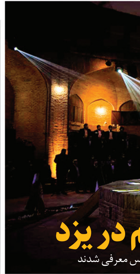
عکس روزنامه‌عمومی تئاتر فجر

استاندار یزد و قادر آشنا، مدیر مرکز هنرهای نمایشی برگزار شد. اسماعیلی، وزیر فرهنگ در سخنانی یادآور شد: «همه اقدامات ما در دولت به این سمت است که فرهنگ و هنر را تقویت کنیم و بر همین اساس حوزه تئاتر در ۴سال پیش‌رو حتما تقویت خواهد شد و در تلاش هستیم تا هرچه مربوط به زیرساخت است، به‌خوبی پیش ببریم. در همین زمینه، بنای ما در وزارت ارشاد بر این بوده که همه تاسیسات و مجموعه‌های فرهنگی که در سال‌های اخیر در دست ساخت بوده‌اند را به اتمام برسانیم. در کل کشور هم فرایند اجرایی