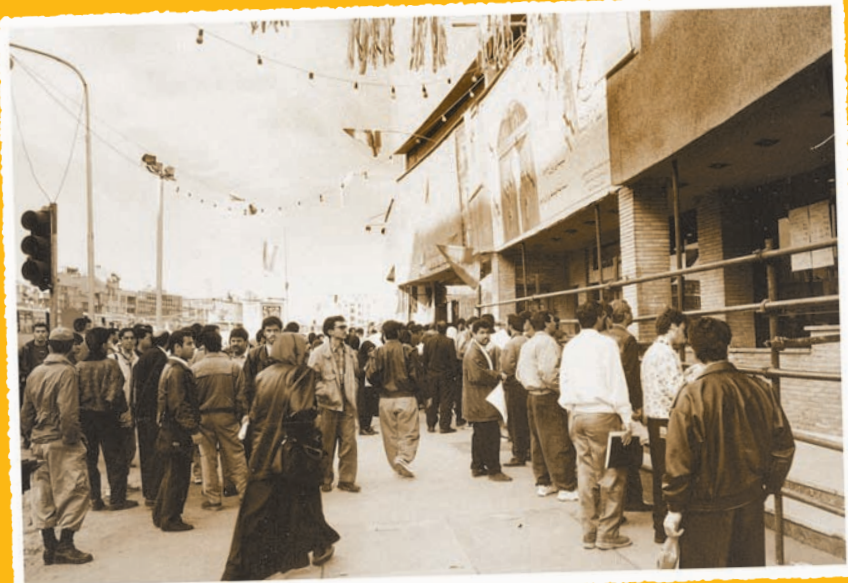
سینما بهمن در دوره سیزدهمین جشنواره فیلم فجر در سال ۱۳۷۲، عکس همشهری، شادروان محمد کربلایی احمد