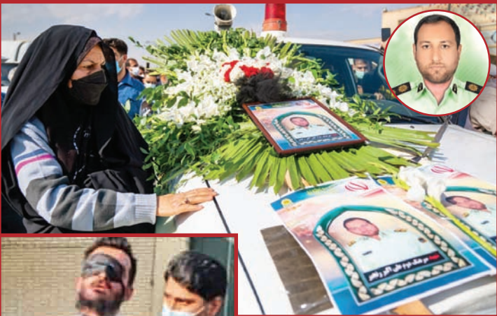
در مراسم تشییع پیکر شهید رنجبر عدد زیادی از مردم شیراز حضور داشتند