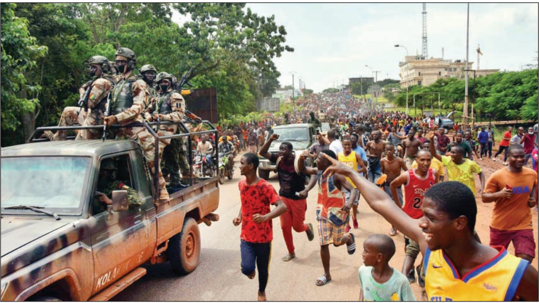
شاه مردم در کنار کودتای خیابان پایتخت گیمه

طی ۱۸ ماه گذشته، ۷ کشور همسایه در قلب قاره آفریقا صحنه کودتاهای موفق و ناموفق بوده‌اند