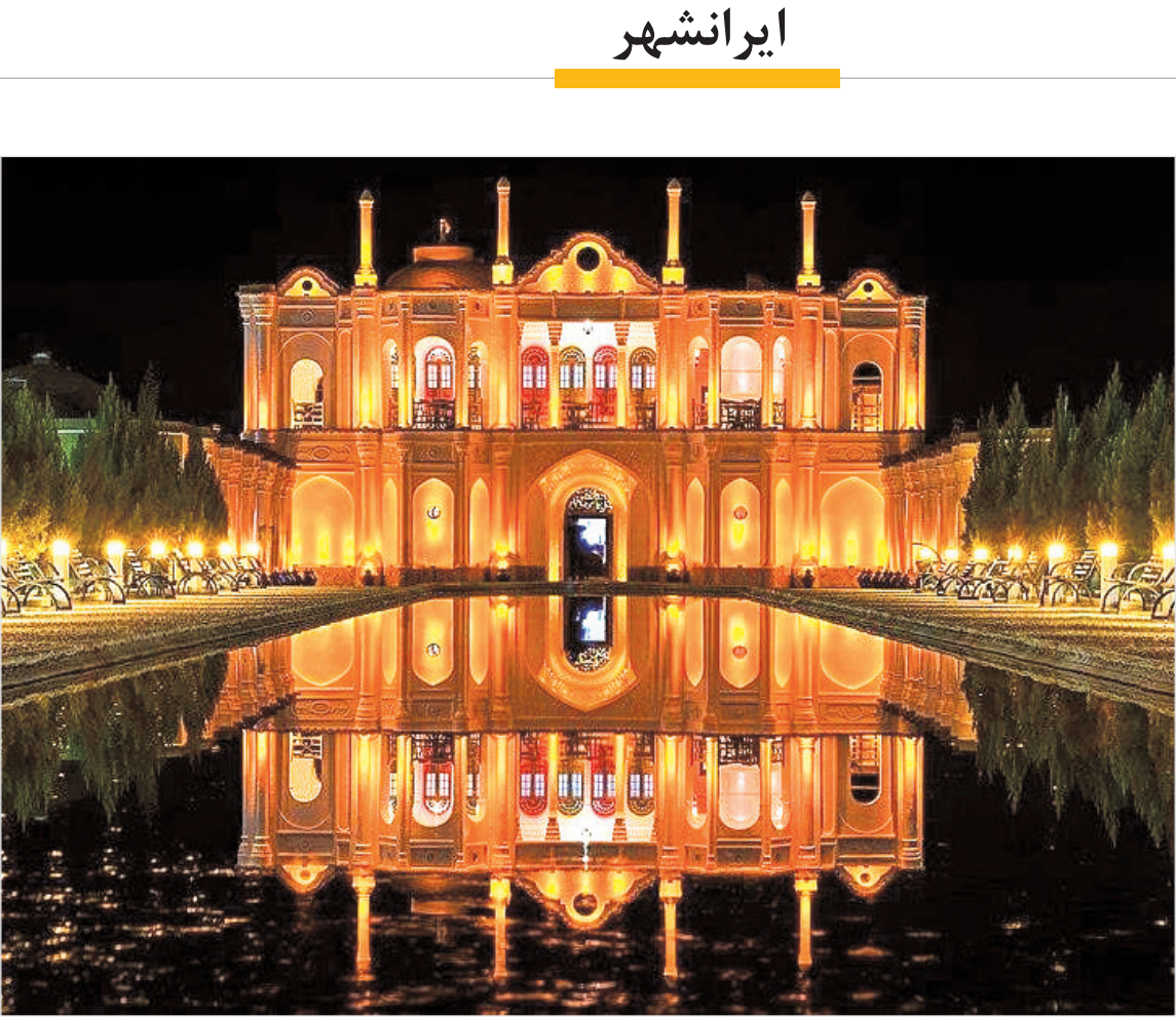
[عکس شارده‌ماهان در کرمان]

نام‌آشنای کودک و نوجوان، ایرج بسطامی،خواننده موسیقی سنتی و…را به ایران تقدیم کند