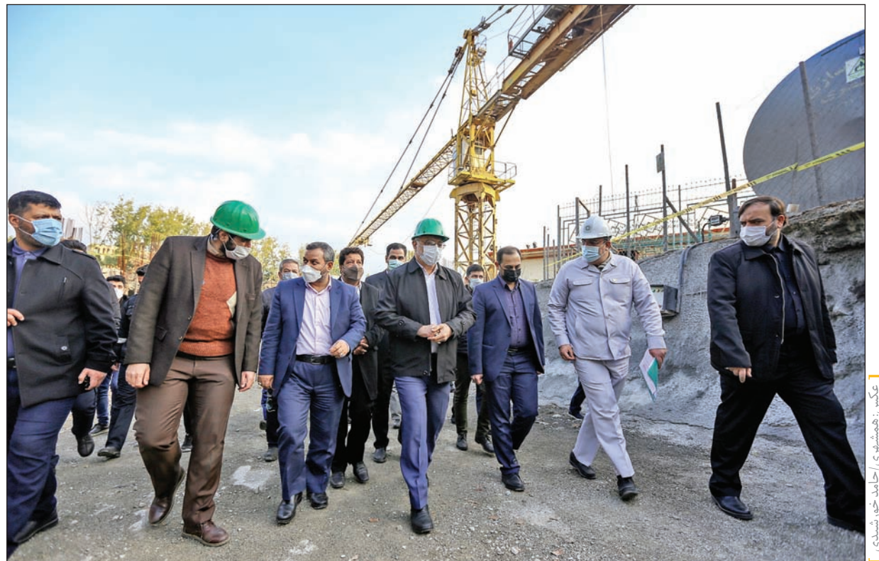
نخستین هم‌نشینی با نیکوکاران منطقه ۳ پایتخت

شهردار تهران: حمایت از بیماران خاص و صعب‌العلاج را وظیفه اساسی می‌دانیم؛ چرا که معتقدیم باید به روح و روان و جسم جامعه پردازیم