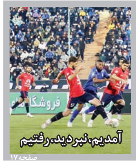
آندوچ، فتر دیده رقتیم