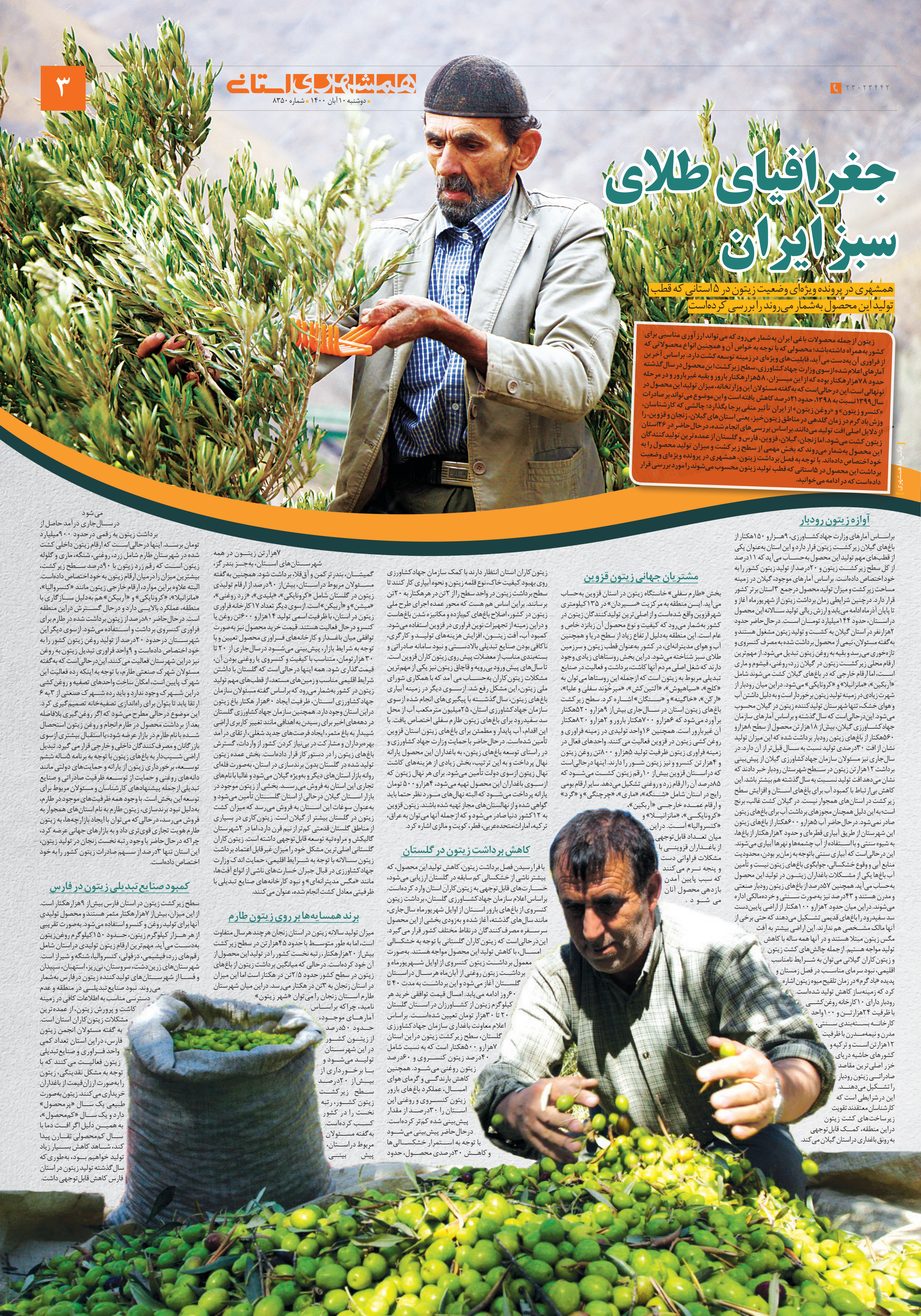
تولید مگس زیتون

سطح زیر کشت زیتون در استان فارس بیش از ۹ هزار هکتار است. از این میزان، بیش از ۷ هزار هکتار متمر هستند و محصول تولیدی آنها برای تولید روغن و کنسرو استفاده می‌شود. به‌صورت تقریبی از هر هزار کیلوگرم زیتون، حدود ۵۰ کیلوگرم روغن زیتون به‌دست می‌آید. مهم‌ترین ارقام زیتون تولیدی در استان شامل رقم‌های زرد، قیشیمی، دزفولی، کنسروالیبا، شنگه و شیراز است. شهرستان‌های زرین‌دشت، سروستان، نی‌ریز، استهبان، سپیدان و فسا از شهرستان‌های تولیدکننده زیتون در فارس به‌شمار می‌روند. نبود صنایع تبدیلی در منطقه و عدم دسترسی مناسب به اطلاعات کافی در زمینه کاشت و پرورش زیتون، از عمده‌ترین مشکلات زیتون کاران استان است. به گفته مسئولان انجمن زیتون فارس، در این استان تعداد کمی واحد فراوری و صنایع تبدیلی زیتون فعالیت می‌کنند که با توجه به مشکل نقدینگی، زیتون را به‌صورت ارزان قیمت از باغداران خریداری می‌کنند. زیتون به‌صورت طبیعی یک سال «پر محصول» دارد و یک سال «کم‌محصول»، به همین دلیل اگر آفت‌دما با سال کم‌محصولی تفسار پیدا کند، شاهد کاهش بسیار زیاد تولید خواهیم بود، به طوری که سال گذشته تولید زیتون در استان فارس کاهش قابل توجهی داشت.