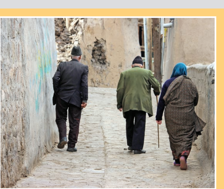
عکس همشهری پیر از آذربایجان