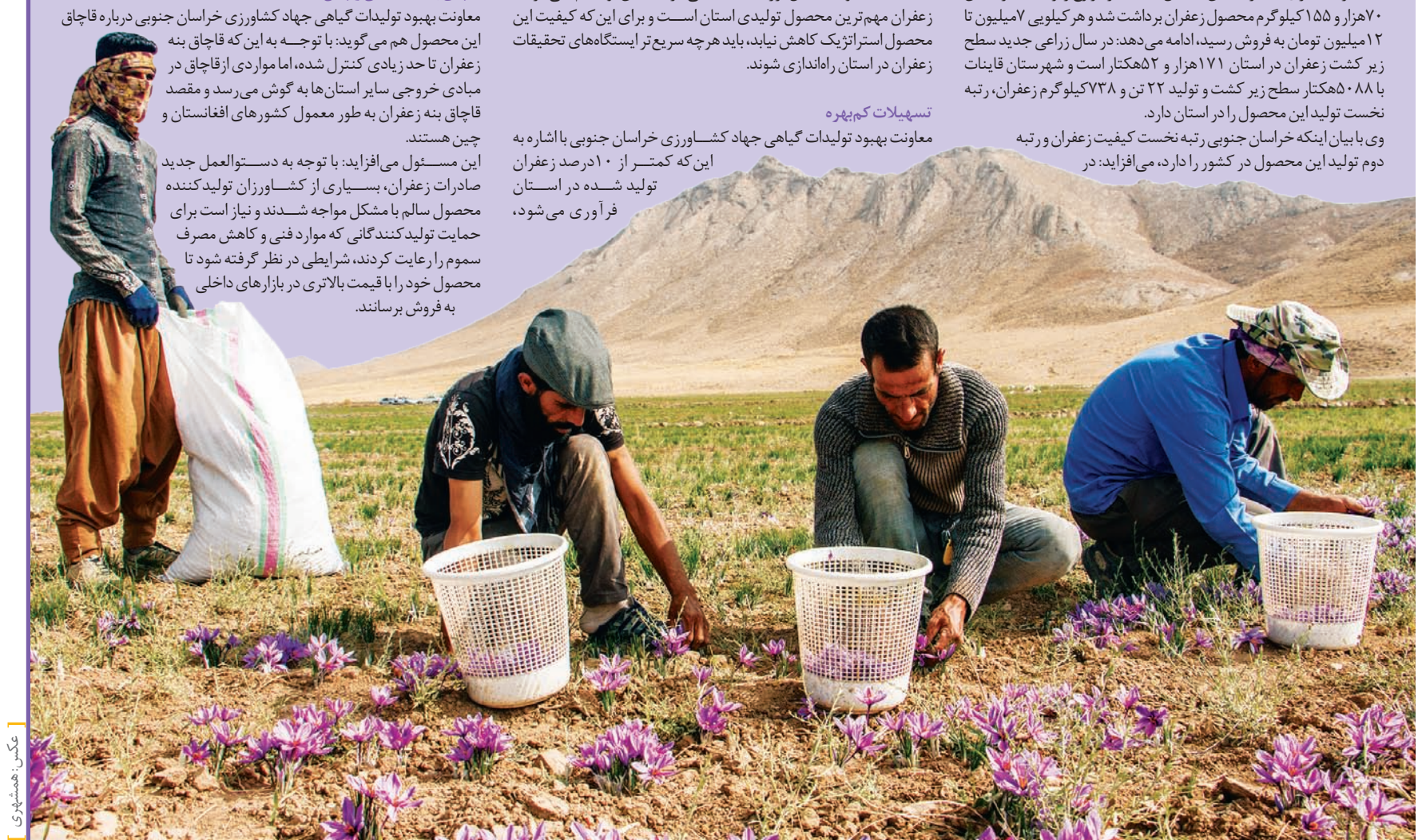
صدا با همشهری

معاونت بهبود تولیدات گیاهی جهاد کشاورزی خراسان جنوبی با اشاره به این که کمتر از ۱۰ درصد زعفران تولید شده در استان فرآوری می‌شود،