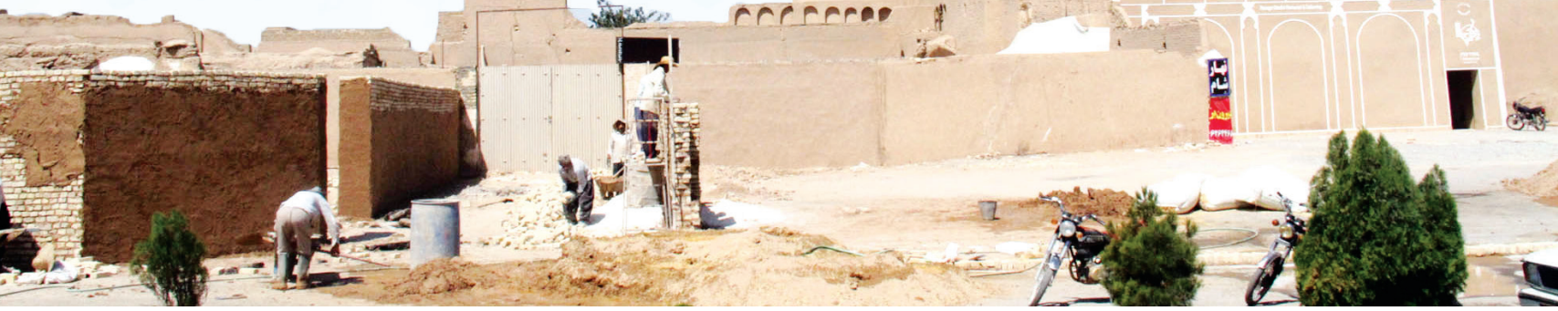
سازمان نظام مهندسی

رئیس سازمان نظام مهندسی ساختمان استان یزد درباره آموزش شیوه‌های معماری سنتی و الزاماتی که در این نوع معماری رعایت شده است، می‌گوید: باید شیوه‌نامه‌ها در کمیسیون‌های تخصصی و انجمن‌های صنفی بررسی و تدوین شود و از سوی دیگر آموزش‌ها بین فارغ‌التحصیلان دانشگاهی تقویت و توسعه داده شود تا الگوی خوبی داشته باشیم که باعث ترویج معماری مطابق با اقلیم و در راستای معماری سنتی یزد باشد. داشتن الگو، ارائه آموزش، خارج شدن معماری اصیل یزدی از تحصیلات آکادمیک به مرحله اجرا و از سوی دیگر ایجاد موانع برای تخلقات ساخت و ساز برای جلوگیری از دور شدن از اصول معماری متناسب با استان کویری یزد از عواملی هستند که می‌توانند باعث شوند یزدی‌ها تا سالیان سسال به معماری خود پایبند و همچنان جهانی بمانند.