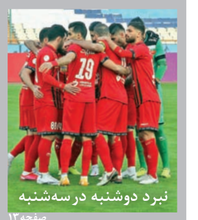
نبرد دو شنبه در سه شنبه

سه شنبه ۲۳ شهریور ۱۴۰۰ • ۷ صفر ۱۴۴۳ • سال بیست و نهم • شماره ۸۳۱۴ • صفحه ۲+ صفحه ویژه استان ها • ۱۶ صفحه راهنما ویژه تهران • ۲۰۰۰ تومان