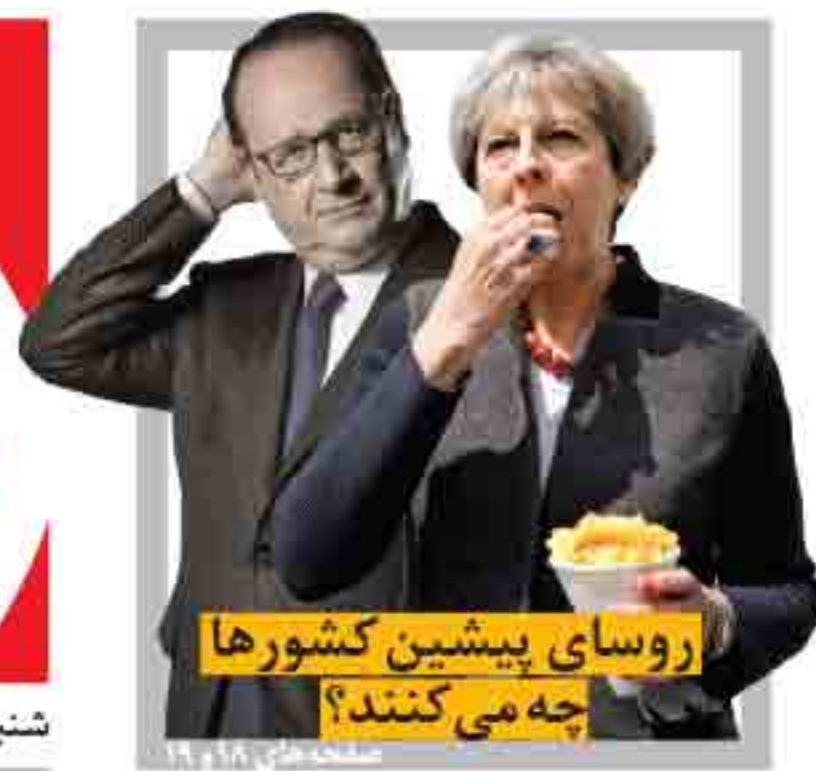
روسی پیشین کشورها چه می‌کنند؟