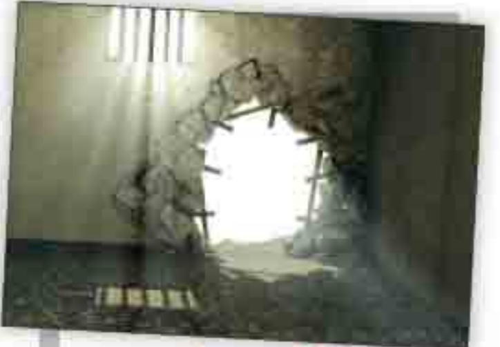
فرار سینمایی ۴ زندانی با شکردهی عجیب از زندانی در فرودس کرج گریختند

شهادت جواد الائمه، ابن الرضا، باب الحوائج، امام محمد تقی علیه السلام را تسلیت می گوئیم