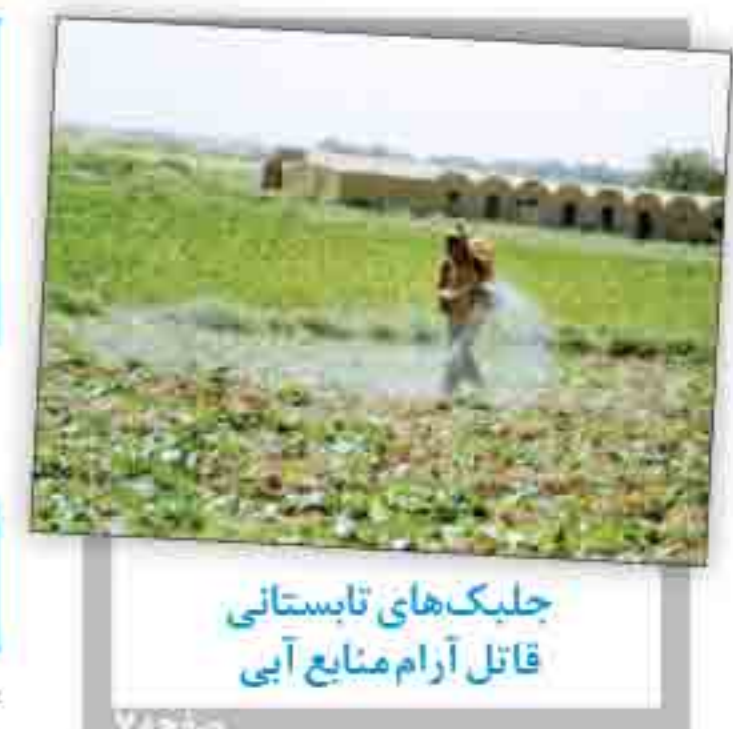
حلبک های تابستانی قائل آرام منابع آبی