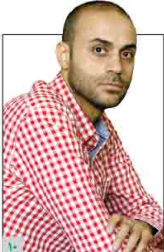
ممنوع الکار نه تعلیق شده بودم