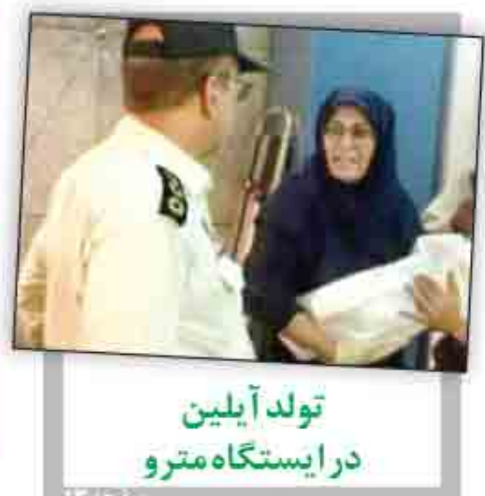
تولد آبلین در ایستگاه مترو