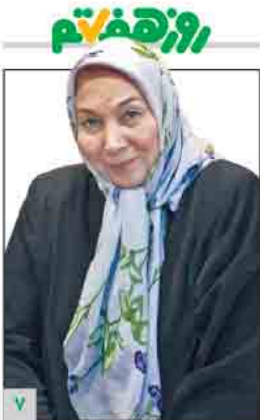
خوشحالم که فراموش نشده‌ام