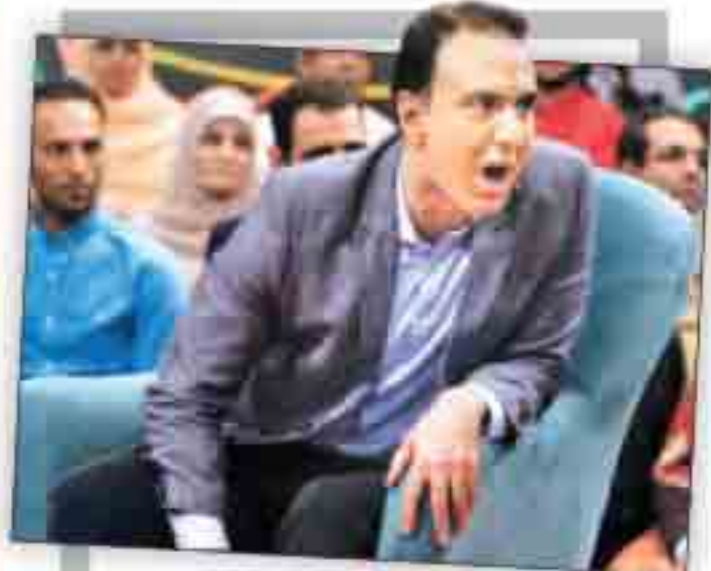
جرامهاجرت مزدگامهم است