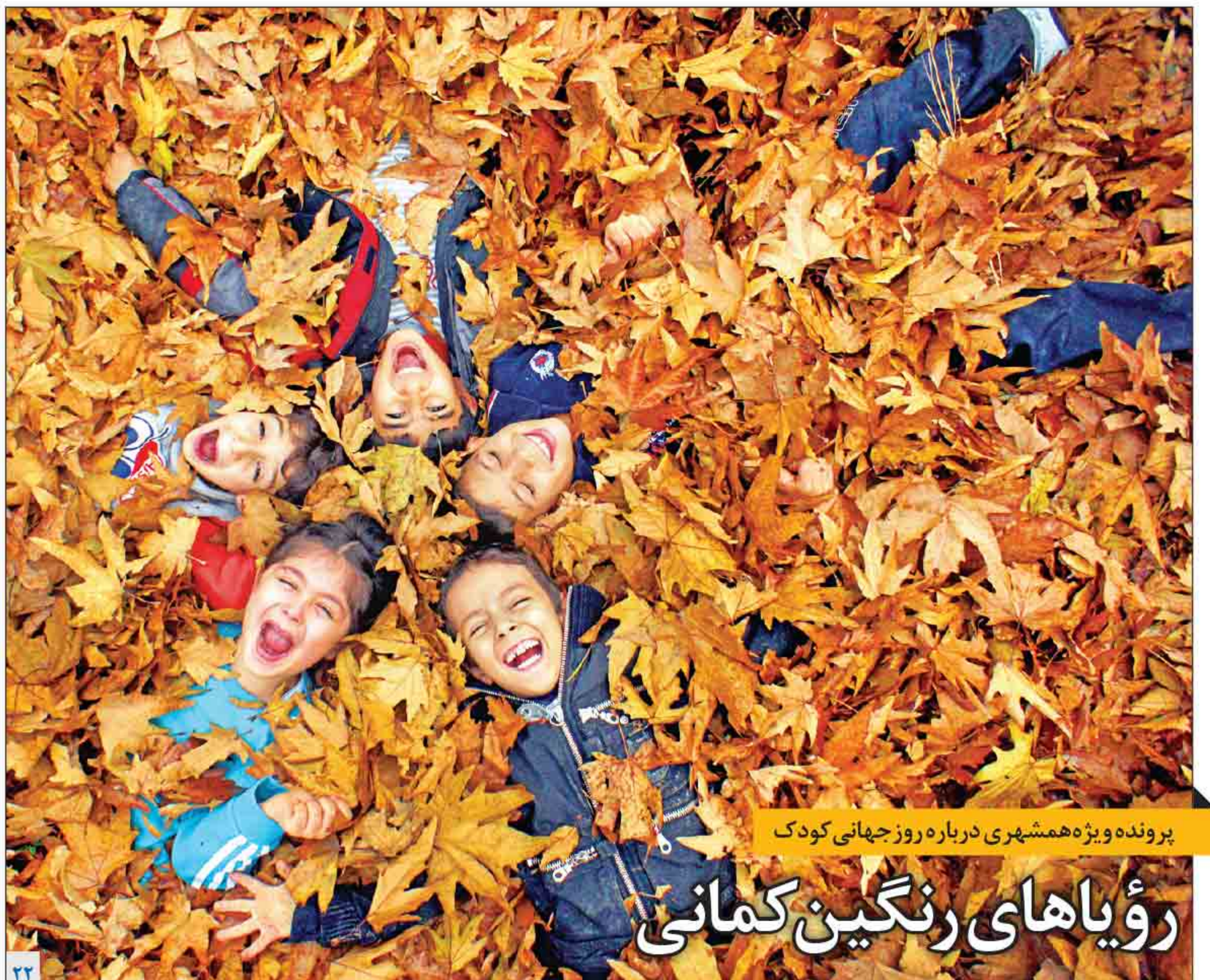
پرورنده ویژه همشهری درباره روز جهانی کودک