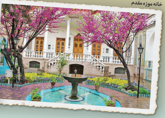
خانه موزه مقدم

بناهای عمومی و شهری دوره قاجار سر آغاز ساخت بناهایی با کاربری عمومی بود که چهره تهران را برای همیشه تغییر داد و آن را به یک پایتخت مدرن نزدیک کرد. مهم‌ترین این بناها مدرسه دارالفنون، یادگار امیرکبیر، بود که به‌عنوان نخستین نهاد آموزش عالی مدرن، سنگ بنای تحولات علمی و اجتماعی ایران شد. در کنار آن، شمس‌العماره به‌عنوان نخستین بنای بلندمرتبه تهران، نماد تمایل ناصرالدین‌شاه برای الگوبرداری از معماری غرب و تماشای پایتخت از فراز بود. ساختارهای شهری دیگری چون بازار تهران نیز در این دوره توسعه یافت و تیمچه‌های مهمی در آن ساخته شد. حتی بناهای متأخری چون سر در باغ ملی، بایانکه در پایان دوره قاجار ساخته شد، همچنان با زبان هنری و کاشیکاری آن دوران، تاریخ تحولات سیاسی را روایت می‌کنند.