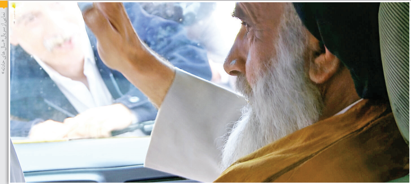
نمایی از سریال «سال‌های خنده»

شهاب مهدوی | چهره‌های معروف سیاسی و تاریخی هر دوره‌ای قابلیت بسیار زیادی برای به تصویر کشیده شدن در سینما و تلویزیون دارند. درباره امام خمینی (ره) به‌عنوان یکی از بزرگ‌ترین و هیران دنیا و بیناتگذار جمهوری اسلامی با توجه به زندگی پرפרاز و نشیمی که داشت، می‌توانستیم بهترین آثار سینمایی را تولید کنیم؛ اما در این سال‌ها کارگردانان معدودی به سراغ رفتند و بعد از تجربه ساخت یک یا ۲ فیلم سینمایی