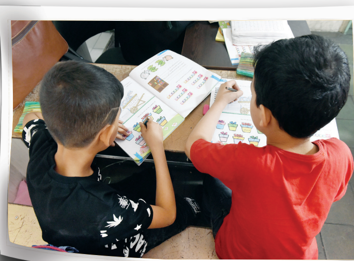
تغییر شاخص‌های

درباره دانش‌آموزان کم‌سواد یا همان مردودی که معاون وزیر آموزش و پرورش تاکید کرد خطر تکرار پایه، بیخ گوششان است