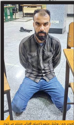
تصویر بدون پوشش متهم با دستور قضایی منتشر می‌شود.