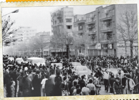
راهبیمایی روزهای انقلاب در سال ۱۳۵۷. حداثت تقاطع وصال شیرازی تا خیابان فلسطین