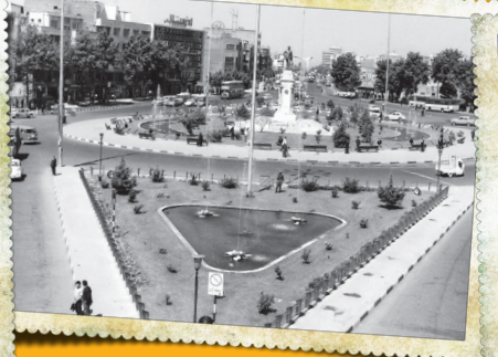
اتابوس‌های دوطبقه و خودروهای قدیمی در میدان / سال ۱۳۴۴