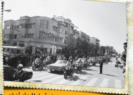
سفر آرمسترانگ و دیگر فضانوردان آپولو ۱۱ به ایران در تقاطع خیابان انقلاب و خیابان ابوریحان در سال ۱۳۴۸