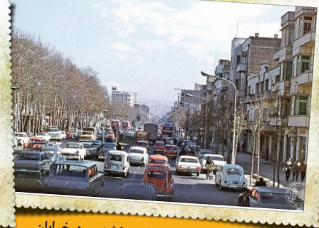
در آن سال‌ها هنوز بل کالج ساخته نشده بود. خیابان انقلاب به سمت شرق، نزدیک چهارراه کالج در سال ۱۳۴۶