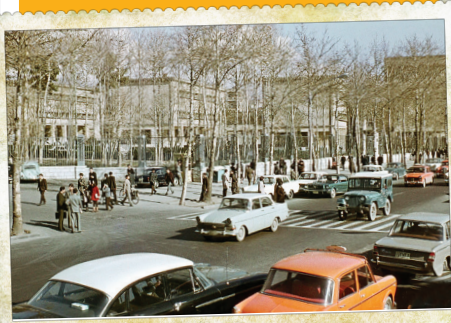
این میدان و خیابان به خاطر دانشگاه تهران و کتاب‌فروشی‌هایش همیشه حال و هوای دانشجویی داشته. تقاطع انقلاب با خیابان ۱۶ آذر (۳۱ آذر قدیم) در سال ۱۳۴۶

در عهد قاجار، خیابان انقلاب امروزی جاده‌ای خاکی بود که مرز شمالی پایتخت را مشخص می‌کرد. در سال ۱۳۱۰ شمسی و در عهد پهلوی اول، پستی و بلندی‌های این خیابان را گرفتند و آن را تبدیل به خیابانی به نام «شاه‌رضا» کردند. آن هم درست چند سال پس از تأسیس دانشگاه تهران. دولت پهلوی برای اینکه هر چه زودتر این خیابان رونق بگیرد قانونی تصویب کرد که براساس آن از ساختمان‌های نوساز این خیابان مالیات نمی‌گرفت و این گونه شد که این خیابان به سرعت به سمت شرق گسترش یافت.