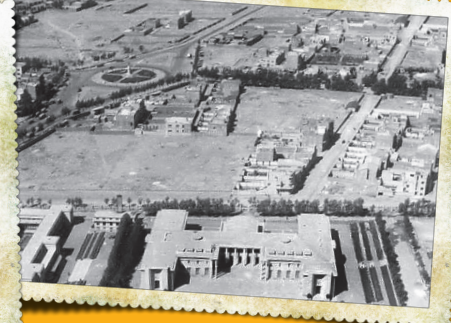
عکس مر یوط به سال ۱۳۲۵: برخی این میدان را با نام میدان مجسمه هم می‌شناختند. پس از انقلاب اسلامی، مجسمه سرنگون و نام این خیابان انقلاب شد.