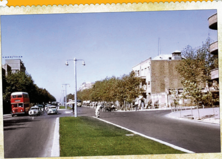
این خیابان این روزها یکی از خیابان‌های پرتردد است و حسرت آن روزهای خلوت را می‌خورد. تقاطع خیابان فلسطین (کاخ) با خیابان انقلاب در سال ۱۳۳۷