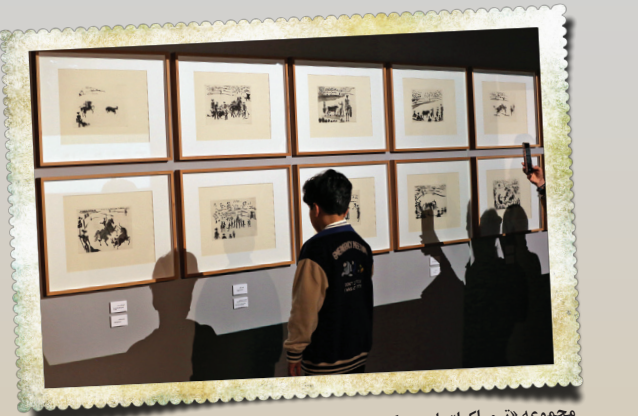
مجموعه «تروماکیا» یا «هنر گاو بازی» یکی از آثار ارزشمند پیکاسو شامل ۲۶ قطعه آکواتینت است که در قالب پورتولیو با ۲۶۱ نسخه منتشر شده است. «تروماکیا» به گاو بازی اشاره دارد؛ ورزشی که به شکل استعاری به مبارزه و نبرد درونی پیکاسو با بحران‌های اجتماعی و سیاسی زمانه اشاره می‌کند. این بخش شامل طراحی‌ها و چاپ‌های خاصی است که گاو وحشی و ماتادورها (گاوآزان) را به تصویر می‌کشد.