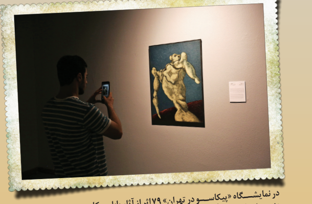
در نمایشگاه «پیکاسو در تهران» ۱۷۹ اثر از آثار پابلو پیکاسو، منتخب ۱۹ اثر از آثار هنرمندانی ایرانی متأثر از پیکاسو از جمله بهرام دبیری، بهمن محضی، جلیل ضیاءپور، محسن وزیری مقدم، مهد علی شیوا (کاکو)، گارنیک درهاکو بیان، آنتیبال لغاخی، پروانه اعتمادی و همچنین منتخبی از آثار هنرمندان خارجی هم‌دوره‌ای پیکاسو مانند رز براک، رابرت دلونه، فرنان لژه و خوان میروا از آثار گنجینه موزه هنرهای معاصر تهران به نمایش درآمده است. ویدئوهایی مرتبط با موضوع نمایشگاه و گرافیک موشن نیز به نمایش درآمده است.