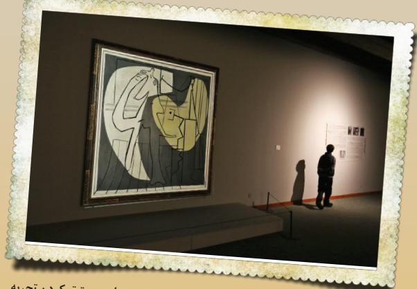
علاوه بر نمایش آثار، موزه هنرهای معاصر برنامه‌های متفاوتی برای عمیق‌تر کردن تجربه بازدیدکنندگان تدارک دید. این برنامه‌ها شامل کارگاه‌های آموزشی، پتل‌های تحلیلی و سخنرانی‌هایی بود که کارشناسان برجسته هنر، تاریخ و جامعه‌شناسی در آن حضور داشتند. این فعالیت‌ها به ارائه درکی جامع‌تر از هنر پیکاسو و تأثیرات او بر فرهنگ جهانی کمک کرد.