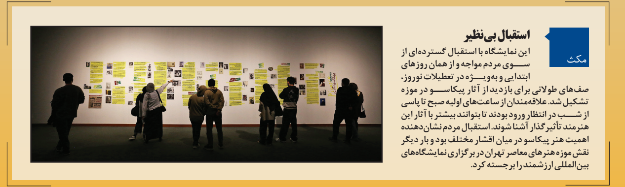
استقبال بی نظیر این نمایشگاه با استقبال گسترده‌ای از سوی مردم مواجه و از همان روزهای ابتدایی و به‌ویژه در تعطیلات نوروز، صف‌های طولانی برای بازدید از آثار پیکاسو در موزه تشکیل شد. علاقه‌مندان از ساعت‌های اولیه صبح تا پاسی از شب در انتظار ورود بودند تا بتوانند بیشتر با آثار این هنرمند تأثیرگذار آشنا شوند. استقبال مردم نشان‌دهنده اهمیت هنر پیکاسو در میان اقشار مختلف بود و بار دیگر نقش موزه هنرهای معاصر تهران در برگزاری نمایشگاه‌های بین‌المللی ارزشمند را برجسته کرد.