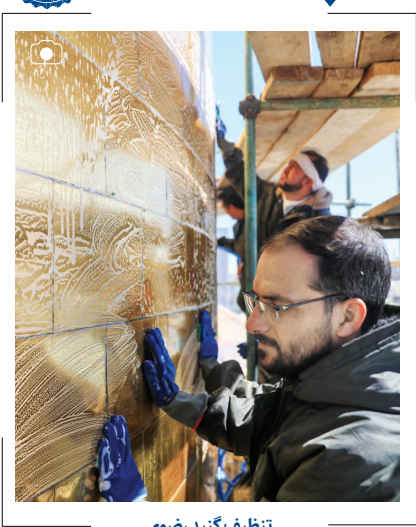
تنظیف گنبد رضوی