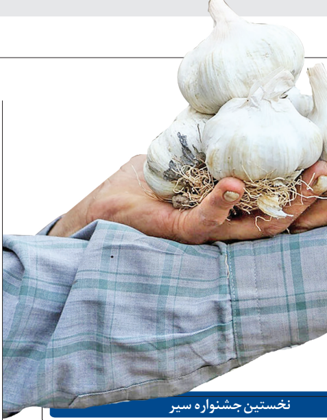
نخستین جشنواره سیر