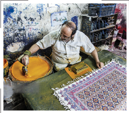
پایتخت قلمکاری ایران

بنابر گزارش سازمان هواشناسی کشور امروز دوشنبه (۲۰ اسفند) فعالیت سامانه بارشی به شکل بارش باران و در ارتفاعات و نواحی سردسیر برف همراه با وزش باد شدید در ۲۲ استان کشور ادامه دارد. کارشناس سازمان هواشناسی کشور با اعلام این خبر به همشهری گفت: «امروز فعالیت سامانه بارشی در آذربایجان شرقی، آذربایجان غربی، کردستان، ایلام، لرستان، همدان، مرکزی، زنجان، قزوین، البرز، تهران، شرق سمنان، خراسان شمالی، خراسان رضوی، خراسان جنوبی، اصفهان، یزد، نیمه شمالی خوزستان، نیمه جنوبی فارس، هرمزگان، کرمان و نیمه شمالی سیستان و بلوچستان پیش بینی می‌شود.» به گفته امین حسین نقشینه، شدت بارش با صدور هشدار هواشناسی زرد در جنوب آذربایجان غربی، آذربایجان شرقی، زنجان، قزوین، البرز و تهران، قم، کردستان، کرمانشاه، ایلام، شمال خوزستان، لرستان، همدان، مرکزی، شمال اصفهان، خراسان رضوی، خراسان جنوبی، جنوب فارس، شمال هرمزگان و ارتفاعات کرمان همراه است.