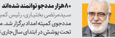
۸۰ هزار مددجو توانمند شده‌اند

«بخوانیم برای ایران» به عنوان شعار سی و ششمین نمایشگاه بین‌المللی کتاب تهران انتخاب شد. ایراهیم حیدری، سخنگو قائم‌مقام سی و ششمین نمایشگاه بین‌المللی کتاب تهران گفت: در تاریخ ۱۶ بهمن (۱۴۰۳) فراخوانی برای دریافت شعارهای پیشنهادی برای سی و ششمین نمایشگاه بین‌المللی کتاب تهران منتشر شد. بر این اساس حدود ۱۵۰۰ شعار به‌دست ما رسیده که در نهایت شعار «بخوانیم برای ایران» شعار سی و ششمین نمایشگاه بین‌المللی کتاب تهران خواهد بود. سخنگو و قائم‌مقام سی و ششمین نمایشگاه بین‌المللی کتاب تهران گفت: همچنین اعضای شورای سیاستگذاری سی و ششمین نمایشگاه بین‌المللی کتاب تهران پس از بررسی گزارش‌های کارشناسان در خصوص محل‌های موجود برای برگزاری نمایشگاه، در نهایت مصلاي امام خمینی (ره) را به عنوان مکان برپایی این نمایشگاه تعیین کردند.