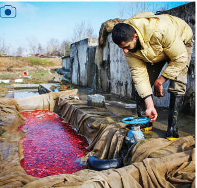
پرورش ماهی قرمز

تولید ماهی قرمز به‌عنوان یکی از نمادهای تزیینی سفره هفت‌سین هر ساله در روزهای پایانی سال رونق بیشتری می‌گیرد. کیلان پیشکام در تولید و پرورش ماهیان قرمز است و رتبه نخست کشور را دارد. گوته‌های مختلف ماهی قرمز شامل «گلد فیش»، «دری کب» و «کالتور» در ۱۰ هکتار از مزرعه پرورش ماهی‌ها در سنگر تولید و از این مزرعه به سراسر کشور ارسال می‌شود.