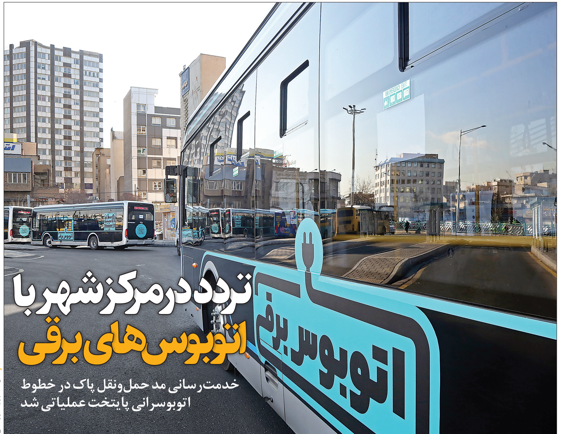
تکس، همشهري، امير رستمی