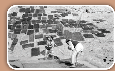
شستن فرش در آب چشمه هزارساله

نزدیک سال نو که می‌شد، اهالی تهران قدیم، به‌ویژه ساکنان ری فرش‌های خود را به دوش می‌گرفتند و به چشمه‌علی می‌بردند و در آن می‌شستند. تعداد فرش‌ها آن قدر زیاد بود که بعد از شستن فرش‌ها تمام تپه‌های سنگی اطراف از فرش‌های رنگی بر می‌شد. انتظار که اهالی قدیمی ری تعریف می‌کنند، فرش‌فروش‌ها و مردم تهران قالی‌ها و قالیچه‌های خود را با این عقیده که آب این چشمه خاصیت دارد و فرش را تمیز و رنگ آن را پر جلا و روشن‌تر می‌کند می‌شستند. آنها فرش‌ها را روی بلندی کوه پهن می‌کردند تا خشک شود و شب جمع‌شان می‌کردند. تاریخچه شکل‌گیری سنت قالی‌شویی در چشمه‌علی موضوع جالبی است که «سید محسن ماجدی»، ری‌پژوه اینگونه دربارش حرف می‌زند: «قالیشویی در اواخر دوره قاجار، پهلوی اول و پهلوی دوم تا حدود دهه ۶۰ در این چشمه رواج داشت. مردم معتقد بودند به خاطر ترکیباتی که آب چشمه دارد این آب فرش‌های دستباف را براق و شفاف می‌کند. این فرهنگ و سنت ابتدا میان اهالی و ساکنان همین محدوده جریان داشت؛ حتی نزدیک نوزدهم خاتم‌های خانه‌دار طرف‌ها و لباس‌هایشان را می‌آوردند و در اینجا می‌شستند. اما بعدها با آمدن وسایل نقلیه بین تهران و ری و آمدن خودروهای باربری به دلیل ایجاد سهولت در حمل فرش‌ها، در نزدیکی این کوه و در امتداد خیابان ابن‌بابویه، قالیشویی‌های زیادی شکل گرفت.»