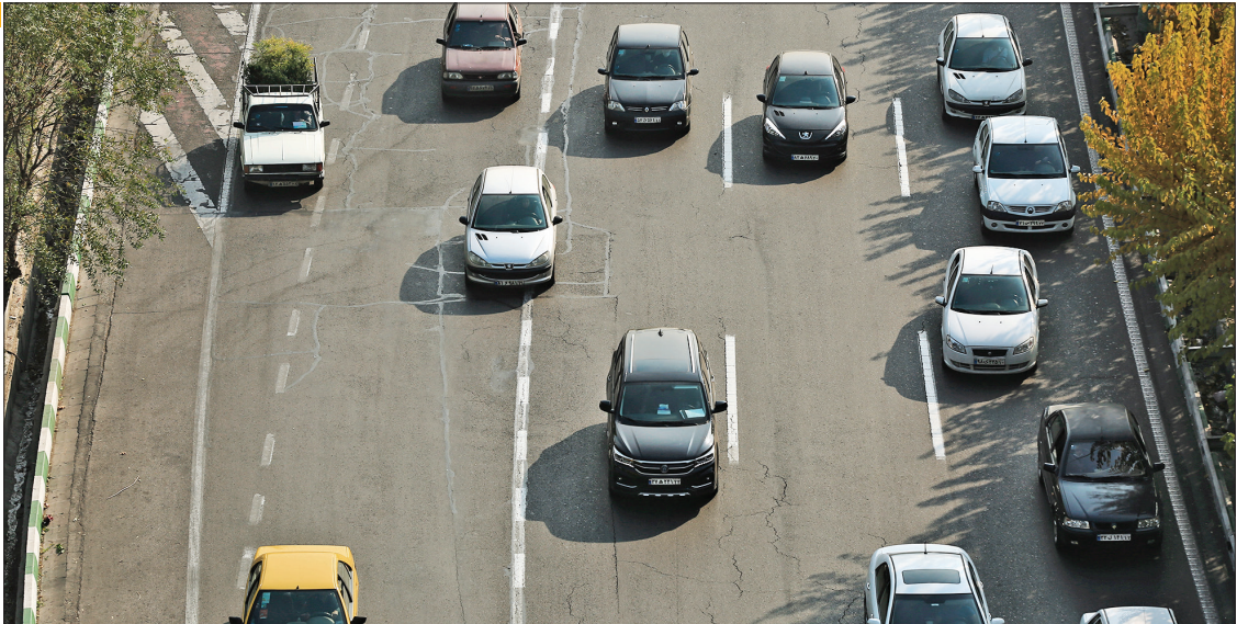
عکس: بهمنشهری/اسفندماه سال ۱۴۰۳

با هدف جلوگیری از تخلفات و کاهش حوادث رانندگی، ثبت تخلفات با شیوه متفاوت انجام می شود