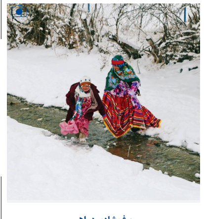
برف شادی در اهر

بارش برف سنگین طی هفته گذشته چهره‌ای سرد و زمستانی به شهرستان اهر داد و شادی را بر چهره مردمان این شهر نشان داد.