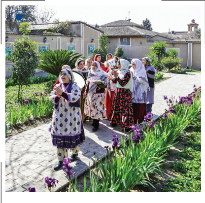
نوروزخوانی: نوروزخوانی یکی از سنت‌های محبوب در میان مردم شمال ایران به‌ویژه در استان گلستان است. در این آیین، هنرمندان پیشکسوت با حرکت در کوچه‌ها و خواندن اشعاری به زبان محلی، نوید رسیدن بهار را می‌دهند و چند روز پیش از آغاز فصل جدید، حال‌وهوای بهار را به خانه‌ها می‌آورند.