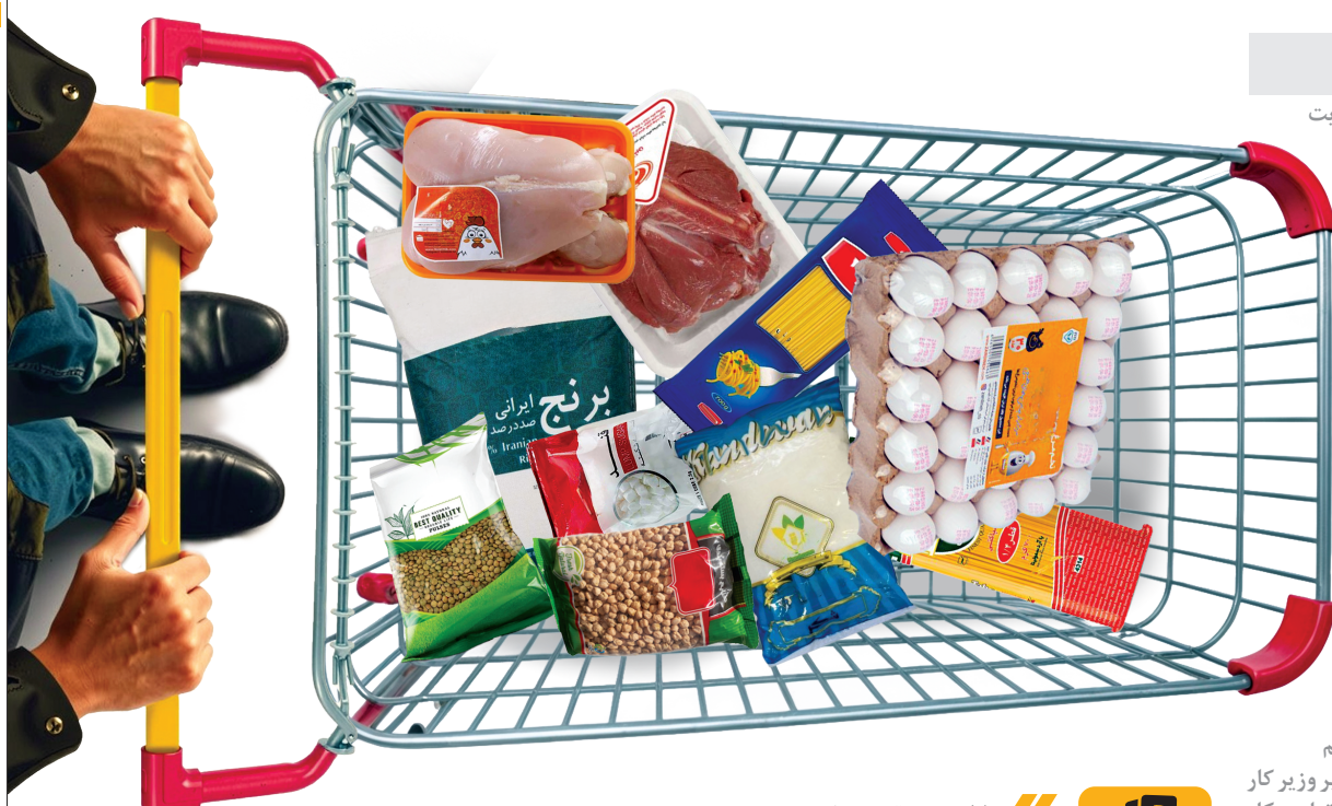
طرح همشهری را اسامی تصدیق

هزینه احراز هویت در شبکه شاپریک ۵ هزار تومان