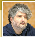
محسن برمهانی معاون صدا و سیما

نباید فراموش کنیم که بخشی از هویت را در اتفاقات مهم تقویمی سال می‌توان دید؛ تهران در ایام شهادت سید و سالار شهیدان سیاه‌پوش می‌شود و در ایام ولادت حضرت حجت، غرق جشن و سرور. اما به نظر می‌رسد که کلانشهری مثل تهران با آن همه ظرفیت مکانی و انسانی، می‌تواند تجلی